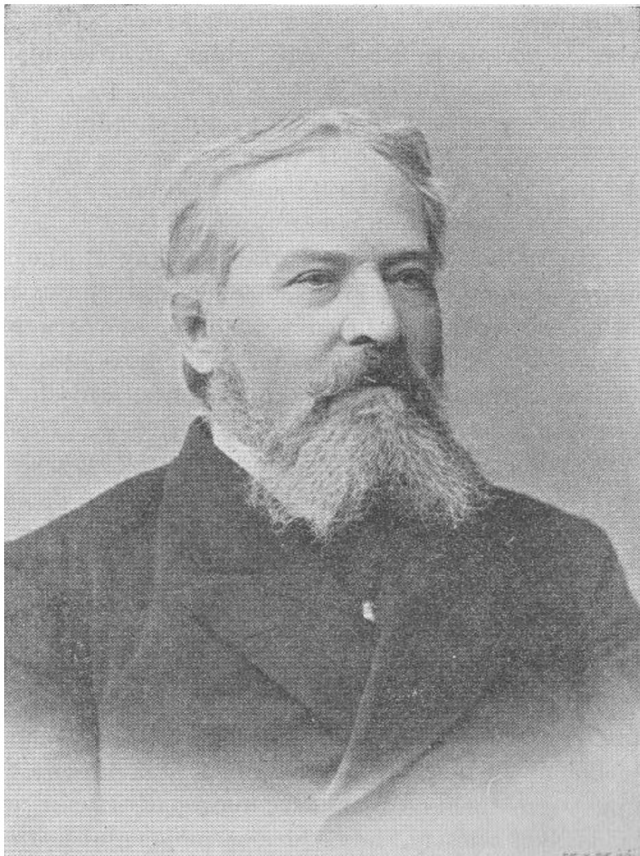
Básník Kornel Ujejski. Lužica 17, č. 7, julij 1898, s. 80.

odběratelů Lužice , pravidelně přispívajících na vydávání lužickosrbské literatury, na chod nejdůležitějších institucí a na vzdělání nastupující inteligence.*