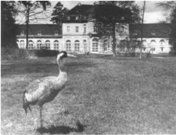
Das Vorbild des „tanzenden Kranichs“. Thomas lebte im Neschwitzter Schlosspark, im Hintergrund das Neue Schloss von Neschwitz – zerstört im Mai 1945.