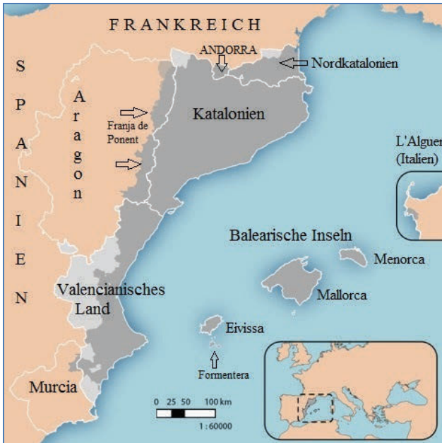
Abb. 1: Die Katalanischen Länder

lanisch-spanischen Spannungsfelds nicht nachvollziehbar ist, wurde jedoch in der Politikwissenschaft bisher wenig Aufmerksamkeit geschenkt. 4