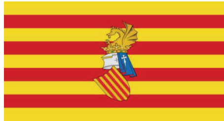
Abb. 3: Flagge des Vorautonomen Rates des Valencianischen Landes

Der Zusammenhang zwischen der kulturellen Sicherheit und der nationalen Identifikation – einerseits mit der katalanischen, andererseits mit der spanischen Nation – entwickelte sich seitdem beinahe kongruent mit der Links-Rechts-Spaltung: „Auf der einen Seite gab es den spanischen Nationalismus, auf der anderen den valencianischen Natio-