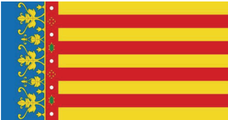
Abb. 2: Flagge der Stadt Valencia (und der späteren Valencianischen Gemeinschaft)