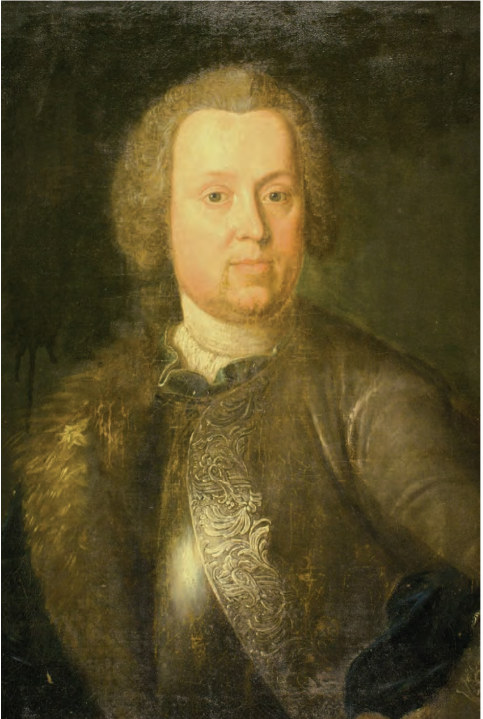
Abb. 1: Friedrich Caspar von Gersdorf (1699–1751). Unbekannter Maler, Öl auf Leinwand, 18. Jahrhundert. UA GS 128.